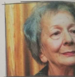
Wisława Szymborska (1923–2012)

Bo przecież chyba jest, naprawdę się wydarzył pod jedną z gwiazd prowincjonalnych 2 . Na swój sposób żywotny i wcale ruchliwy. Jak na marnego wyrodka kryształu – dość poważnie zdziwiony. Jak na trudne dzieciństwo w koniecznościach stada – nieźle już poszczególny. Patrzcie go!